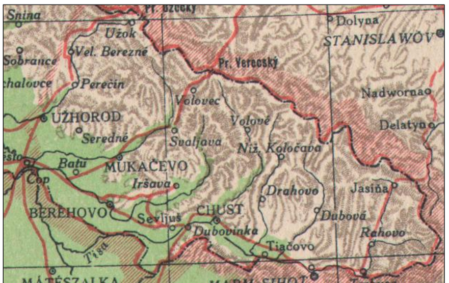
Mapa Československé republiky z roku 1928, výřez Podkarpatské Rusi.

< Unikátní záběr z bosenského Sarajeva zachycující zatčení Gavrila Principa na místě atentátu na nábřeží řeky Miljačky 28. 4.1918.