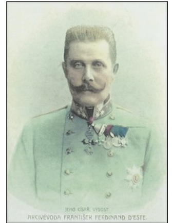
Úřední portrét následníka trůnu jeho výsosti arcivévod Františka Ferdinande d'Este.

< Rodinná fotografie následníka a jeho milující ženy Žofie Marie Josefíny Albíny Chotkové, hraběnky z Chotkova a Vojnina, kněžny z Hohenbergu, která byla roku 1909 povýšena na vévodkyni.