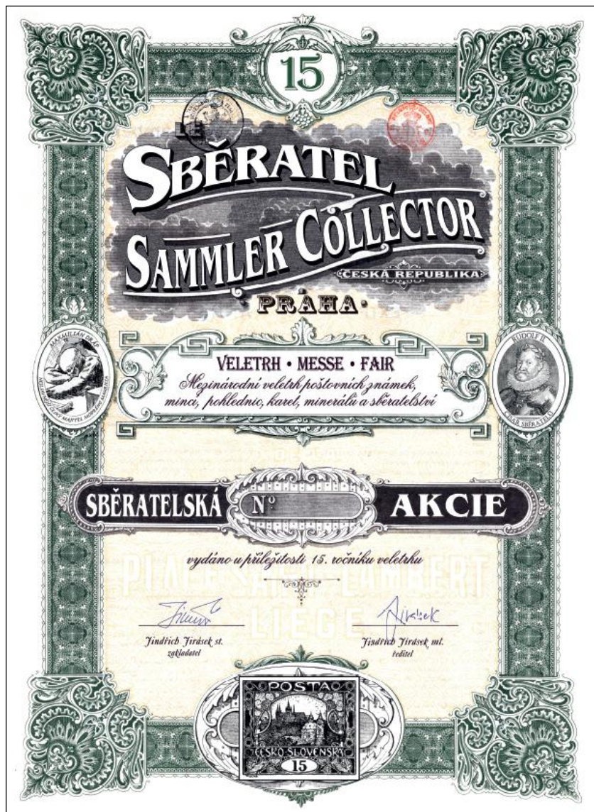
Veletržní správou vydaná pamětní sběratelská akcie v limitovaném počtu 500 kusů