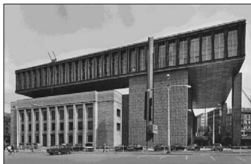
Budova Federálního shromáždění v Praze (1973)

dva samostatné státy. Pro dnešní generaci nic podstatného, ale pro nás, kteří to prožívali, byl rozpad státu něčím přelomovým. Příslušnost ke státu Československému je nějak zakořeněná a koneckonců je to poznat i na našich sbírkách. Cenné papíry čs. firem vedeme pod společným fondem, protože řada emisí na sebe navazuje jak v roce 1939, tak 1993.