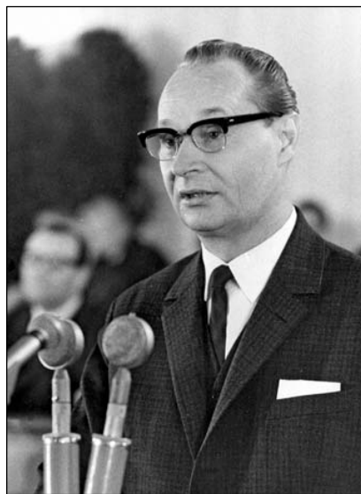
Alexander Dubček (27.11.1921-7.11.1992)