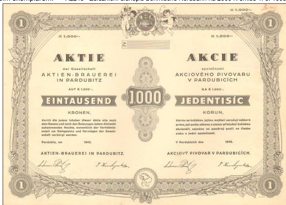
A2239 – Nátisk akcie Akciového pivovaru v Pardubicích emise 1942 bez data emise, ale s podpisy

ve velmi často bez podpisů, čímž se obvykle rozpoznají od blanketů vydaných akcií a na nátisku jak barevném, tak černobílém nebyvá zpravidla datum. Někdy však rozlišení blanketu a nátisků je velmi obtížné.