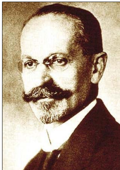
Emil Kolben (1.11.1862 – 3.7.1943)

Na 25. listopadu 1992 připadá výročí dvaceti let kdy Federální shromáždění odhlasovalo rozdělení Československa na