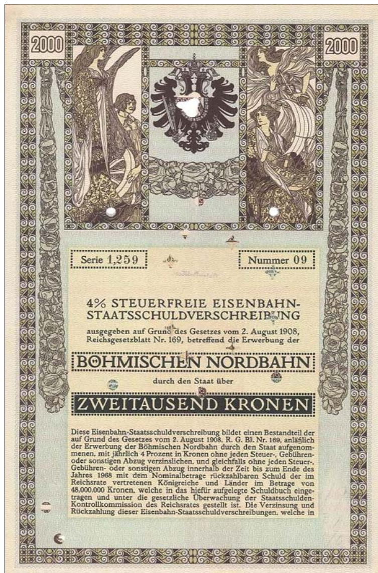
A2243 - Železniční dluhopis Böhmische Nordbahn na 2000 K emise 1. 8. 1908

Další zajímavý přírůstek je černobílý nátisk akcie Akciového pivovaru v Pardubicích. Emise živých akcií byla vydána 1. října 1942 a grafický návrh provedla místní tiskárna akcií J. Otto & Růžička. Právě u akcií pardubického pivovaru existuje celá řada barevných nátisků i černobílých obtahů. Ve vydaném katalogu pivovarů a sladoven jsou tyto typy uváděny, ale jejich celkový rozsah nebyl doposud plně podchycen. Z jiných případů víme, že nátisky byly tištěny asi ve 2-5 exemplářích. Barevné zkoušky byly vždy pro zvolení odstínu klientem, černobílé pak pro schválení textu akcie příslušnými úřady, zda jsou v souladu se stanovami. V tomto případě je na rubu akcie nalepen kolek 1 K emise 1939 a razítko ministerstva, které text schválilo, bohužel není čitelné. Barevné nátisky jsou provedeny velmi často bez podpisů, čímž se obvykle rozpoznají od blanketů vydaných akcií a na nátisku jak barevném, tak černobílém nebyvá zpravidla datum. Někdy však rozlišení blanketu a nátisků je velmi obtížné.