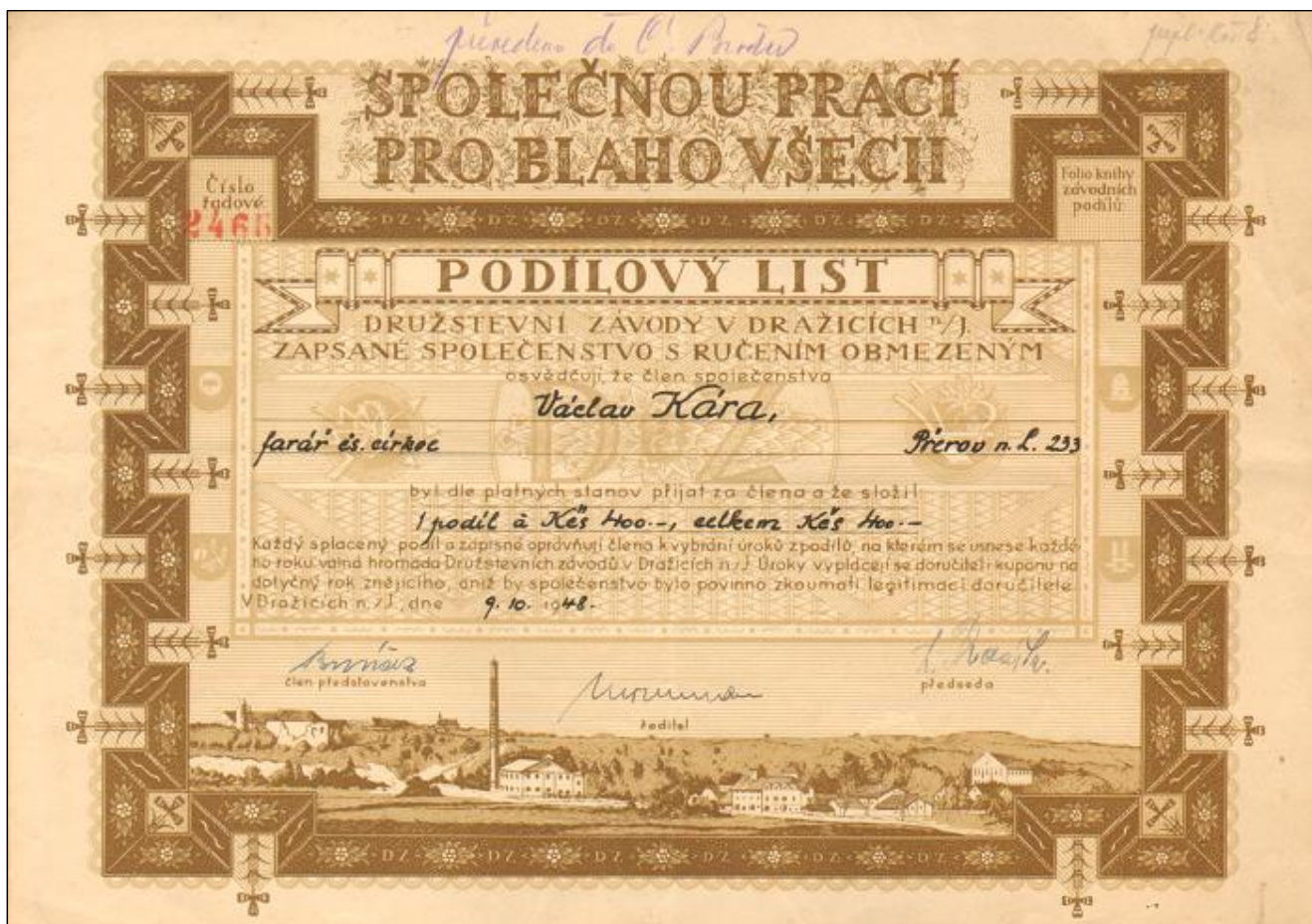
A2242 – podílový list Družstevních závodů v Dražicích, vydaný 9. 10. 1948 na 400 Kčs a porovnání detailů emise 1927 (A2185) a 1948 (A2242)